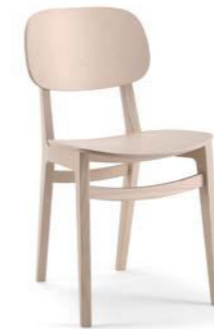
X-Kiti / S