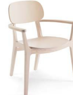
X-Kiti / P