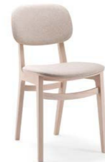
X-Kiti / SI