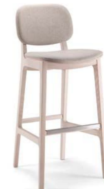
X-Kiti / SGI