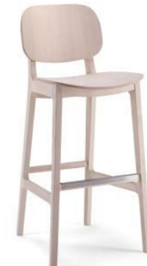
X-Kiti / SG