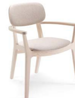
X-Kiti / PI